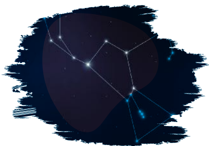
Representación de la Constelación de Orión

Por esa época del año el cielo está generosamente despejado, las diferentes estrellas titilan con más fuerza de lo normal y sobresalían tres de ellas, tenían el poder de que fijara totalmente mi atención (aún hoy, a mis 44 años, lo hacen); son las 3 estrellas del cinturón de Orión. Sus nombres son 'Mintaka', 'Alnitak' y 'Anilam', sin embargo, se les conoce como 'Las tres Marías' o 'Los tres Reyes Magos' y forman una brillante alineación donde una de ellas está ligeramente inclinada.